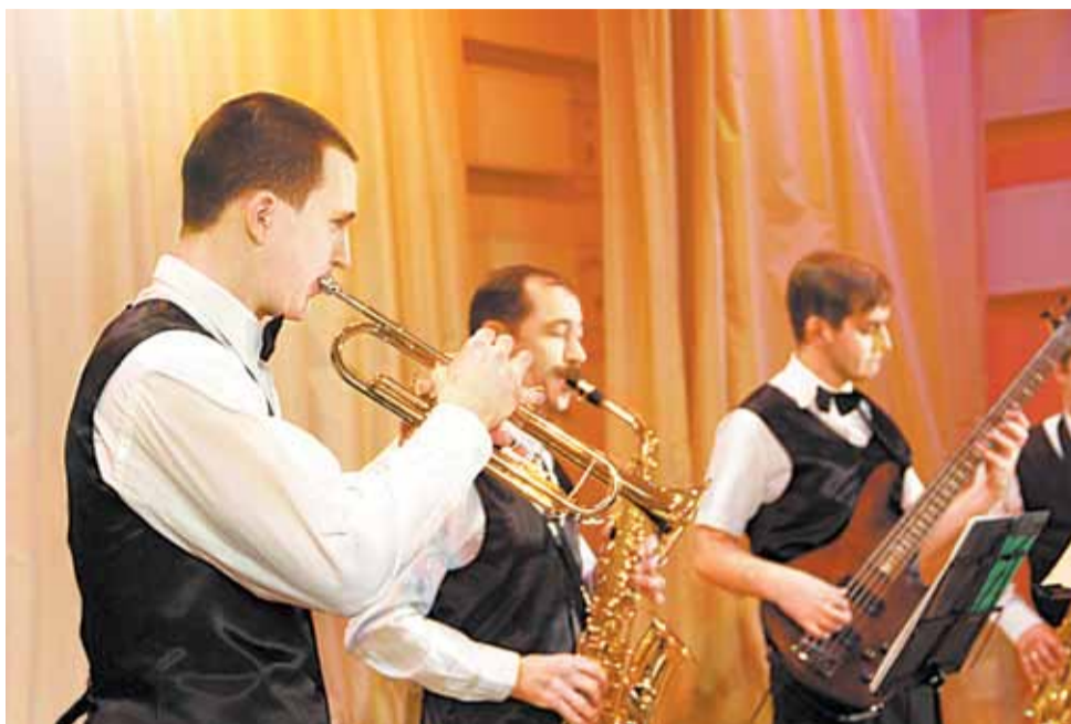
Ансамбль «Брасс», ДШИ п. Баранчинский

Всероссийский конкурс исполнителей эстрады и джаза TAKE FIVE в нынешнем году состоялся лишь второй раз, однако собрал 84 заявки от солистов, ансамблей и оркестров (в соответствии с номинациями) из 16 горо-