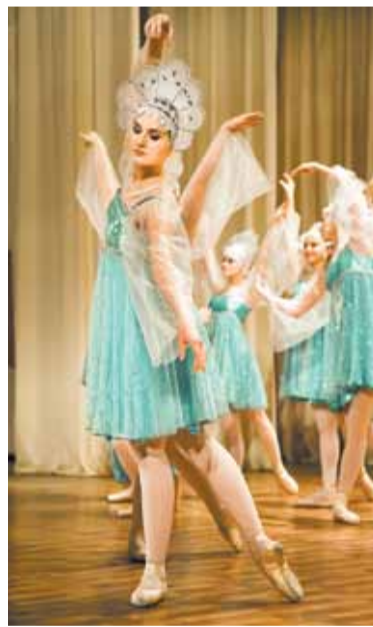
Образцовый коллектив «Балетная мозаика»