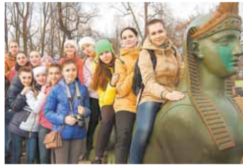
«ТанцПространство» в Санкт-Петербурге

большую часть которого составляют преподаватели с многолетним стажем. Молодых, к сожалению, не много, но все они – энергичные, инициативные.