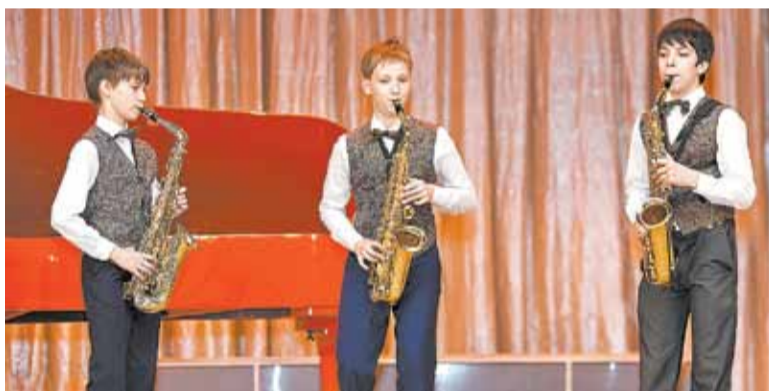
Трио «Молодые сеньоры»

ляться собственные творческие коллективы и новые отделения, педагогов пополнили молодыми кадрами. Сегодня контингент ДМШ № 3 – это свыше 300 человек, и лишь 20 из них обучаются на общеразвивающем (общеестетическом) направлении. Практически все осваивают предпрофессиональные программы, при поступлении на которые проверяются чувство ритма, мелодический и гармонический слух, музыкальная память. Конкурсы на общеразвивающие программы нет, есть тестирование, исключительно для того, чтобы знать перспективы ребенка. Итогом является растущий показатель поступления выпускников школы в профильные средние и высшие учебные заведения, который достиг в про-