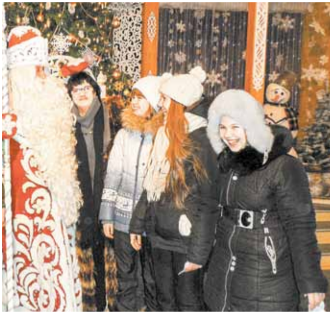
С учениками в Великом Устюге