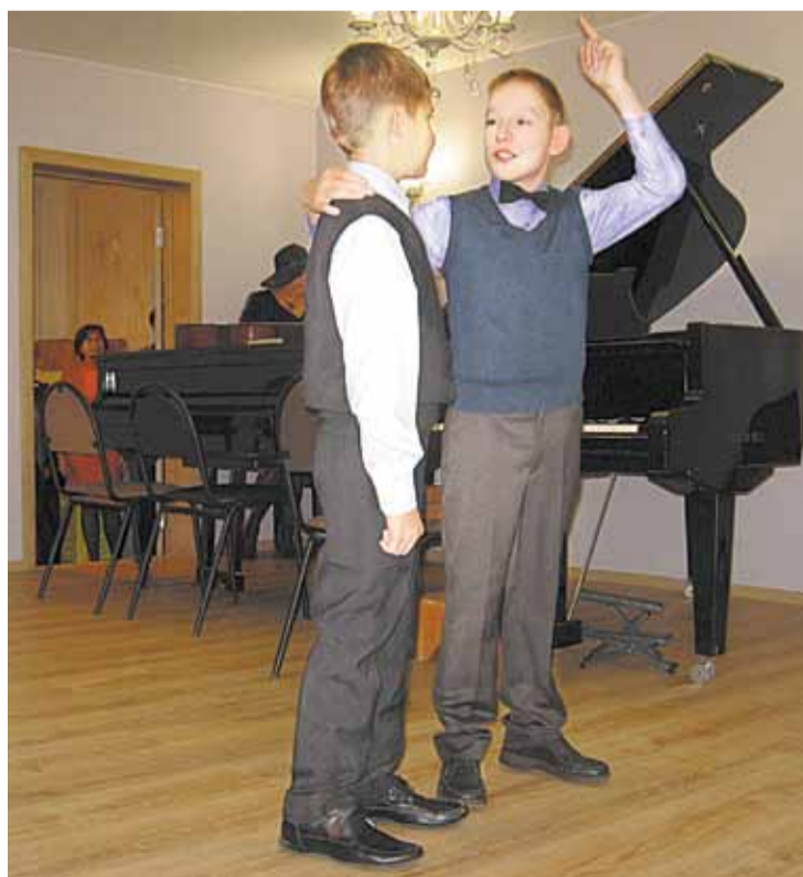
В роли спасателей

Праздник проходит ежегодно с неизменным аншлагом. Зал достаточно большой, но зрителям буквально не хватает мест. Потому что «прошлогодние» первоклассники снова приходят на праздник, правда, сидят они уже не на первых рядах. Это значит, что к музыке, к очень непростому искусству общаются новые граждане Музыкантии.