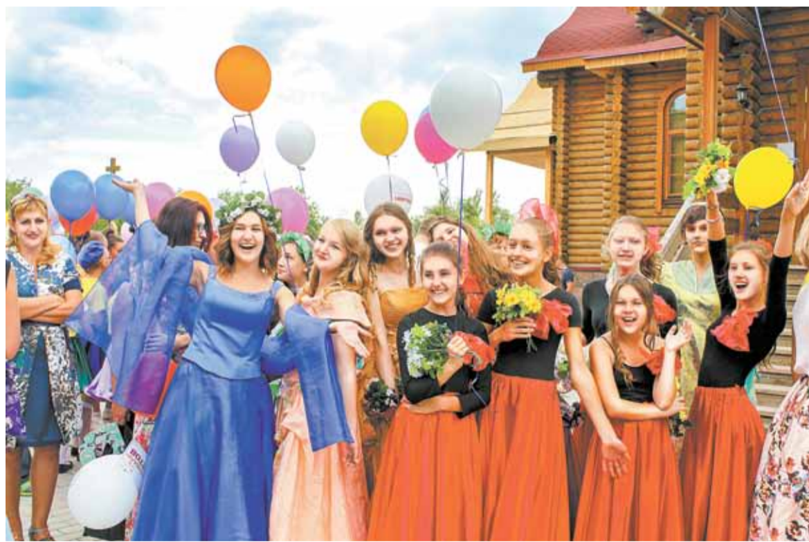
Хоровой коллектив «Фантазия» на празднике цветов